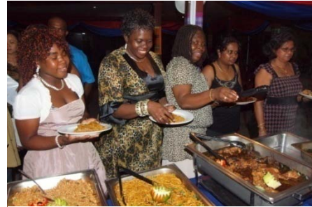
Na de diploma-uitreiking was er een gezellig samenzijn onder het genot van een lopend buffet.