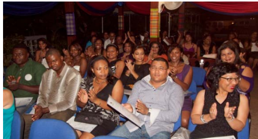
Een blik in de zaal bij de diploma-uitreiking.