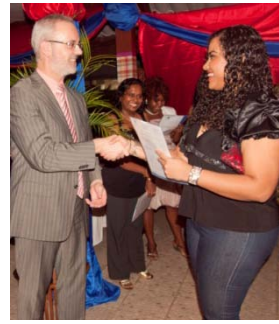
Een cursist ontvangt haar diploma.