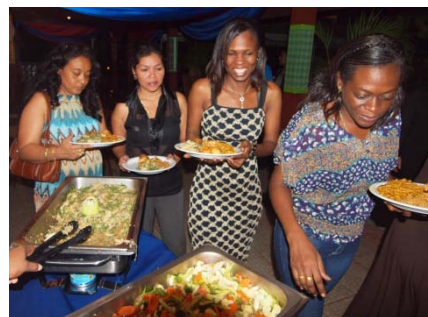
Na de diploma-uitreiking was er een gezellig samenzijn onder het genot van een lopend buffet.