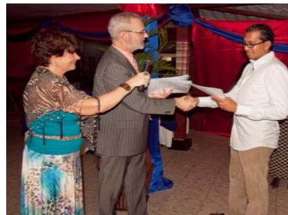
Een cursist ontvangt zijn diploma.