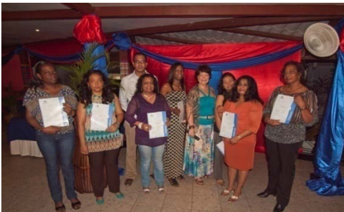
Een deel van de geslaagden...