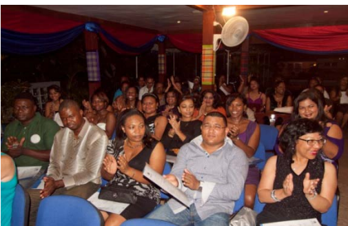
Een blik in de zaal bij de diploma-uitreiking.